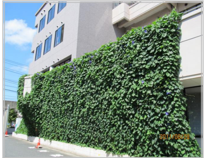
1階をすっかり覆ってしまいました (H23)