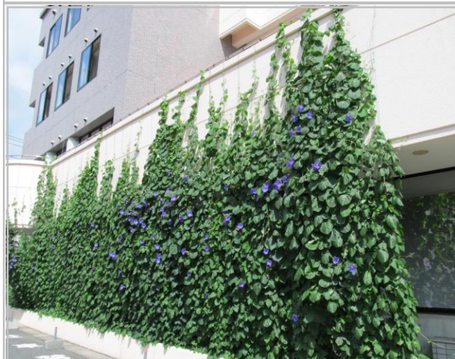
8月13日 グングン伸びてきました。