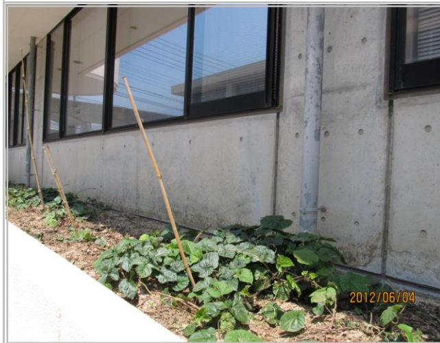
今年6月 籐(しの)の支えを立てました。