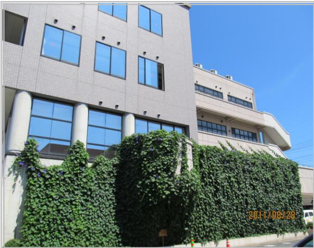
昨年8月末のグリーンカーテン (H23)