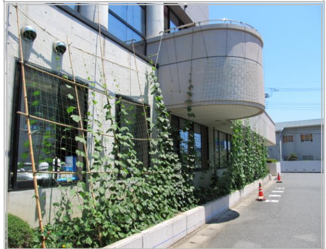
6月末 2階に届くまでネットを張ります。